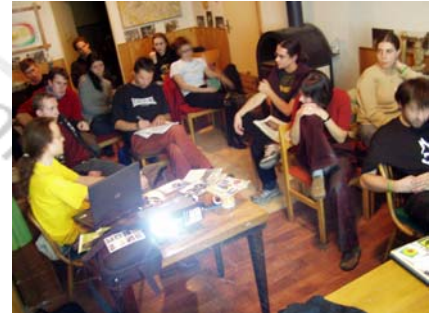
Přednáška na Klimavíkendu